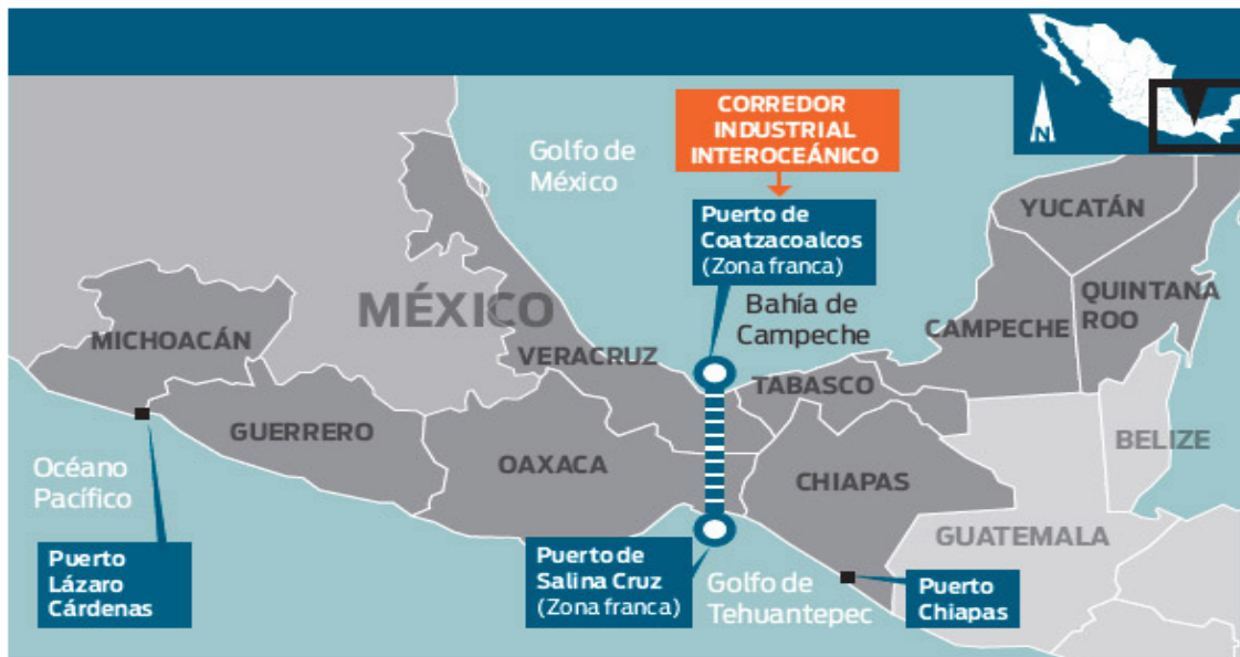
Mapa 3. Zona Económica Especial en México

El CMI será parte muy importante para recuperar esta zona, pero también será beneficiada por el desarrollo de infraestructura e impulso comercial, de servicios y desarrollo tecnológico para mejorar el intercambio de mercancías con Europa y Asia y para ello se requiere no solo de voluntad política, sino de una política publica ad hoc a las nuevas necesidades de la economía global.