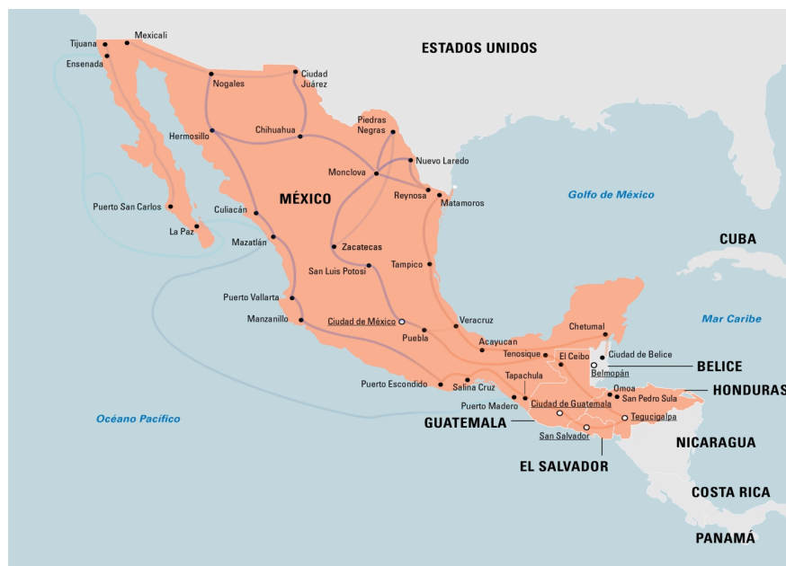
Mapa 2, Migración al norte

En México algunos de los ecosistemas se han ido deteriorando debido a la degradación ambiental,